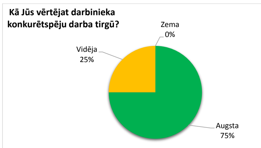
2.attēls. Darba devēju vērtējums par BVK studiju virziena “ Vadība, administrēšana un nekustamo īpašumu pārvaldība ” absolventu konkurētspēju darba tirgū

Darbinieka – BVK studiju virziena “Vadība, administrēšana un nekustamo īpašumu pārvaldība” absolventu konkurētspēju darba tirgū lielākā daļa darba devēju vērtē kā augstu (skat. 2. attēlu).