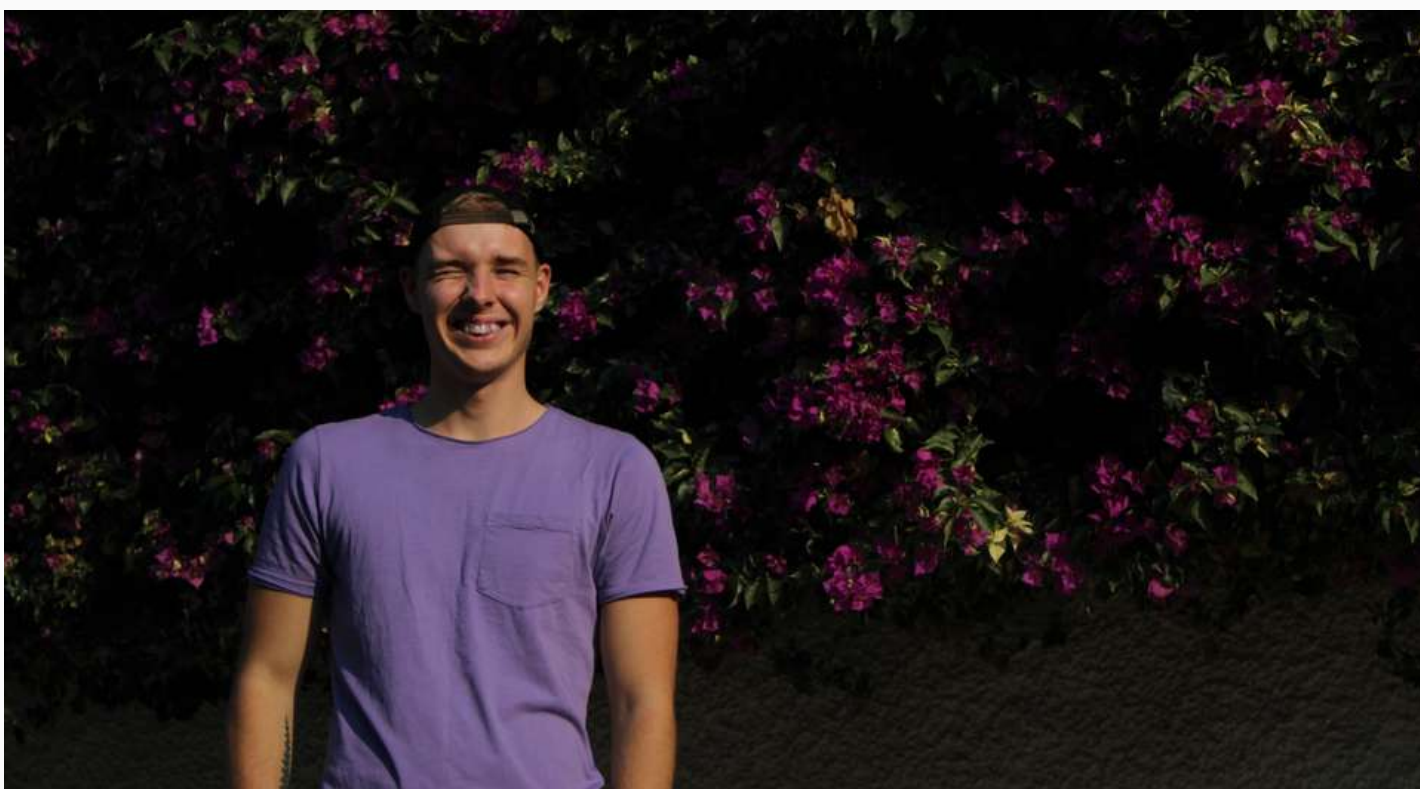
FOTO: EDGARS KANĀRIJU SALĀS, 2021. GADA RUDENĪ.

ar mācībām saistītiem braucieniem arī es interesējos augstskolās, kuras, caur Erasmus+ programmu, piedāvā studentiem apgūt praksi vai studēt kādā ārvalstu augstskolā termiņā līdz pat 12 mēnešiem. Aktīvi arī meklēju ar darbu saistītos braucienus, ko piedāvā Salto-Youth jeb septiņu resursu centru tīkls, kas strādā pie Eiropas prioritārajām jomām jaunatnes jomā. Salto-Youth arī darbojas Erasmus+ projektu kā arī Eiropas Solidaritātes korpusa ietvaros.