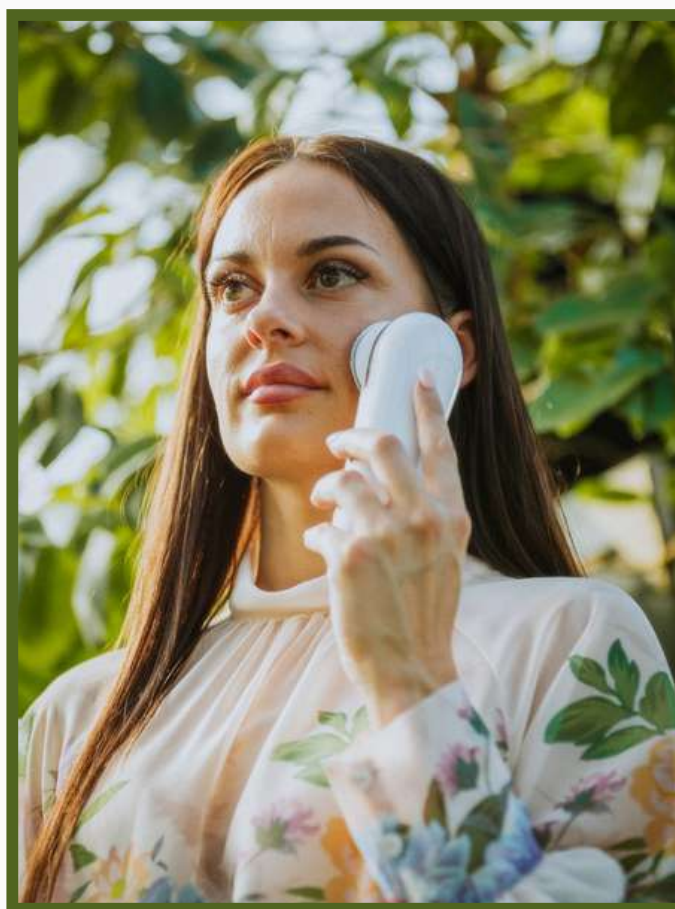
FOTO: INETAS UZŅĒMUMA PRODUKTA PIELIETOJUMS.

Jā, piedalos Mentor programā, tā gan ir pilnīgi jauna programma un