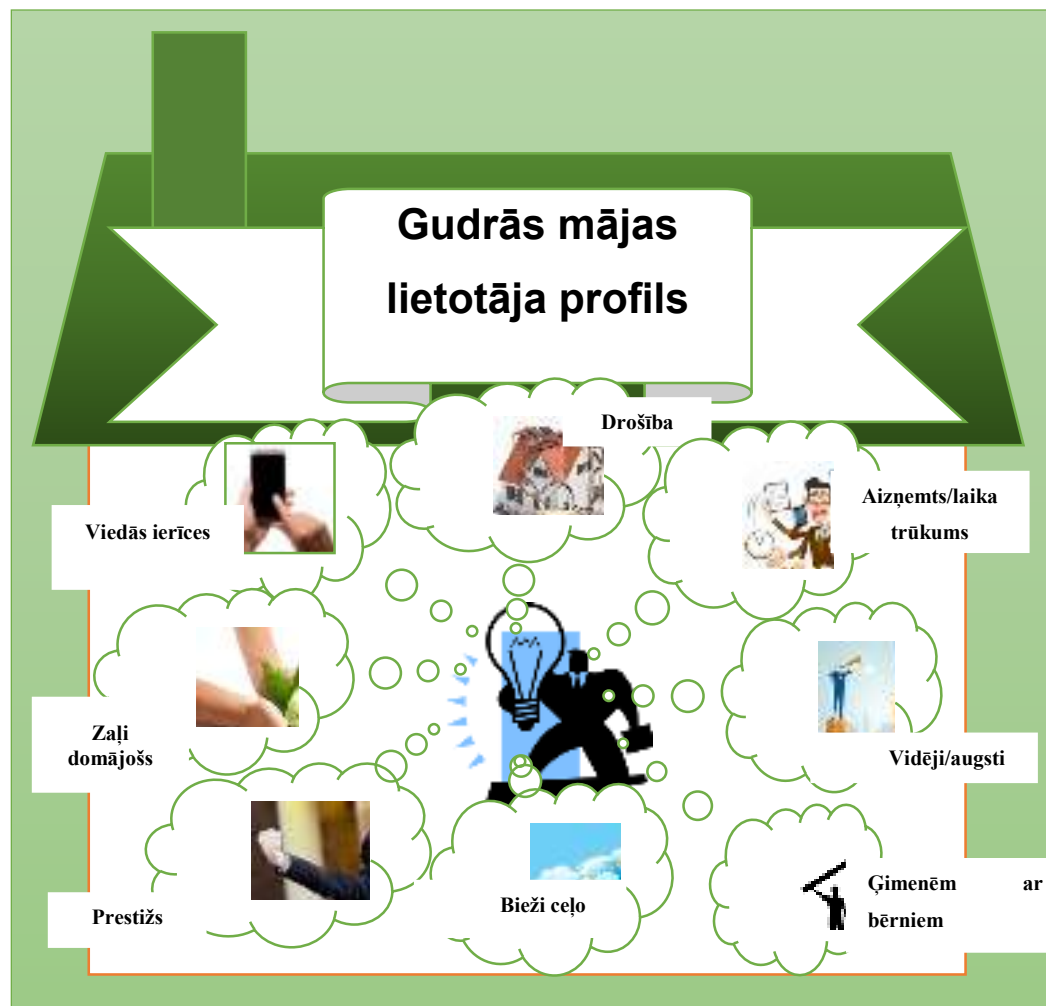
3. attēls. Gudrās mājas lietotāja profils (attēls autora veidots).

Pirmkārt nepieciešama prasme apieties ar viedajām ierīcēm, t.i., viedtālruniņiem, datoriem, planšetēm u.t.t. Šī ir būtiskākā īpašība, kas nepieciešama, jo gudrās mājas principi tiek balstīti uz mājas pārvaldību, izmantojot viedierīces. Šīm prasmēm nav jābūt ļoti augstā līmenī, taču lietotājam ir jāsaprot pamatprincipi, kā pārvaldīt aplikāciju, kas kontrolē paredzētās darbības.