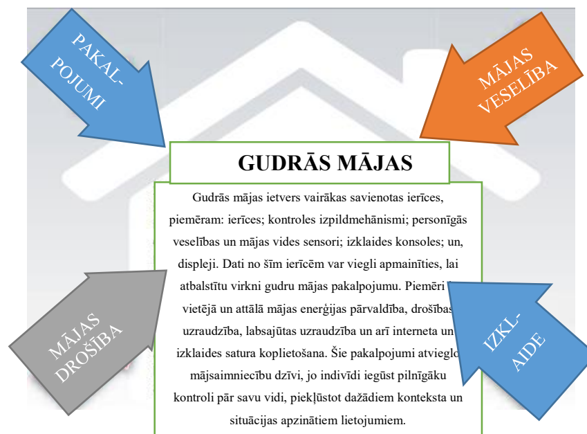
2. attēls. Guadrās mājas vīzija, ko veicina četri industrijas segmenti (attēls no pētījuma: “Vision of Smart Home The Role of Mobile in the Home of the Future”)

Patērētājiem viedo māju pakalpojumu galvenā vērtība būs saistīto ierīču informācija un kontrole mājās neatkarīgi no tā, kur tie atrodas. Patērētāji spēs pārraudzīt un kontrolēt vairākas mājas ierīces dažādos displejos, ideāli izmantojot to pašu, viegli lasāmo programmu nodrošinājumu, izmantojot mobilo telefonu, kas kalpos kā primārā ierīce attālinātai piekļuvei mājas informācijai. Māju saimnieki, iedzīvotāji varēs attāli kontrolēt visu informāciju, izmantojot savus mobilos tālruņus.